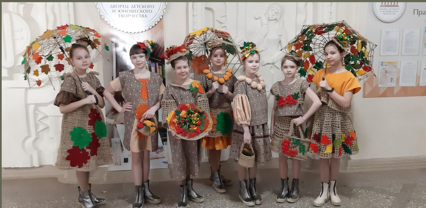
Коллекция «Красавица осень»